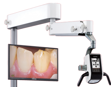
販売名：ネクストビジョン 一般的名称：可搬型手術用顕微鏡/手術用顕微鏡/歯科用口腔内カメラ 届出番号：13B1X00133000079 (一般特管設置)